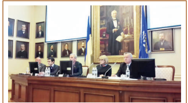
Установчі збори НЛРУ, Київ, 23 листопада 2015 р. Члени Президії

24 вересня 2020 р. представники НЛРУ, ВУЛТ, Української медичної експертної спільноти (УМЕС) на брифінгу в агенції «Інтерфакс» у зв'язку з неврахуванням пропозицій від громадськості та ігноруванням більш як десятилітніх напрацювань українських фахівців у царині лікарського само-