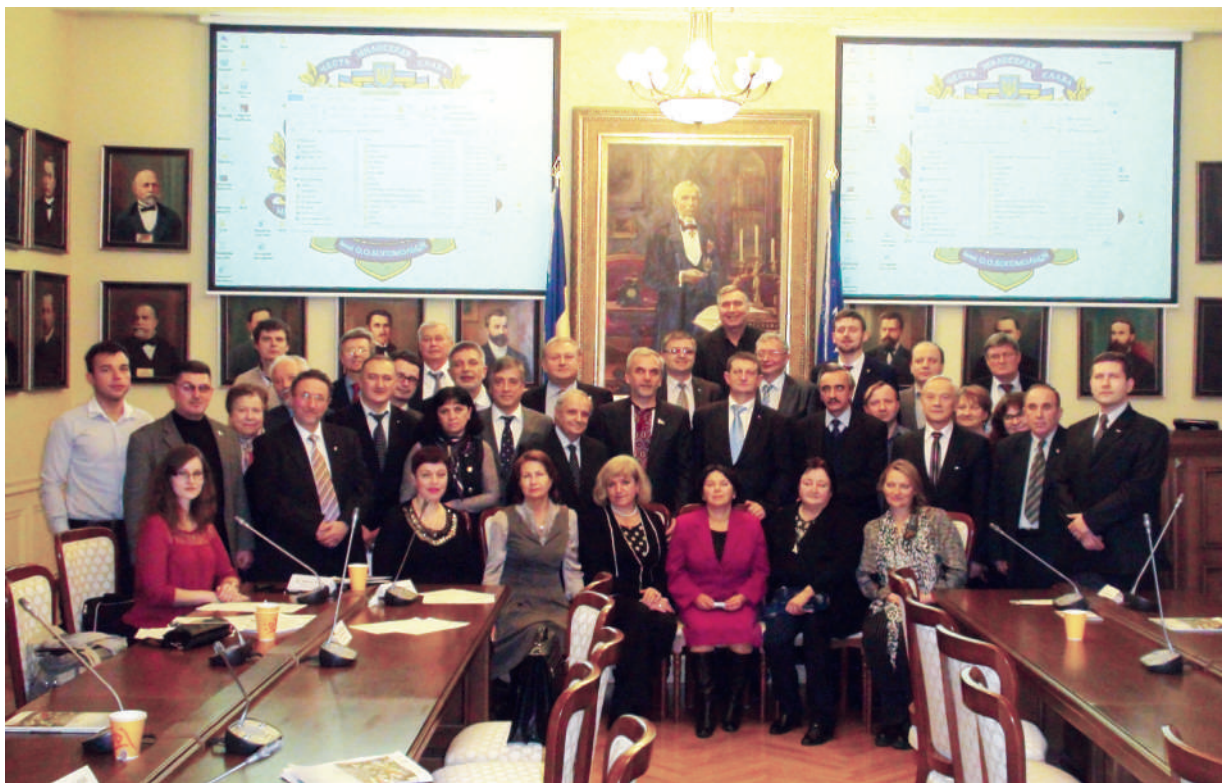
Установчі збори Національної Лікарської Ради України, Київ, 23 листопада 2015 р.