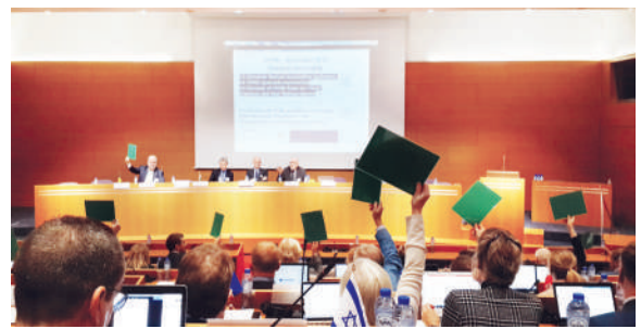
Засідання генеральної асамблеї Постійного комітету лікарів Європи, Брюссель, 25 листопада 2017 р. Голосування щодо вступу лікарів України до ЄРМЕ