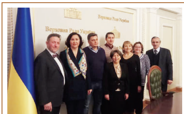
IV річне засідання НЛРУ, Київ, 12 грудня 2018 р.