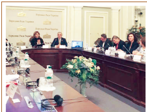
Засідання круглого столу на тему «Партнерство в публічному управлінні охороною здоров'я для підвищення людського потенціалу нації» у Верховній Раді України, Київ, 12 грудня 2018 р.