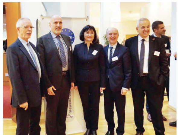
Засідання генеральної асамблеї Постійного комітету лікарів Європи, Брюссель, 25 листопада 2017 р. Вітання для лікарів України від президентів ЄРМЕ і UEMS зі вступом до Постійного комітету лікарів Європи та запрошення України до вступу до Європейської спілки медичних спеціалістів (European Union of Medical Specialists)