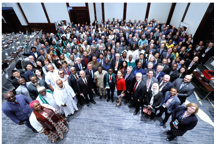
Рис. 2. Лікарська спільнота, об'єднана Світовим Лікарським Товариством

Пандемія COVID-19 не тільки не ослабила взаємодію із WMA, а навпаки, зробила стосунки української і світової лікарських спільнот більш тісними. Світове Лікарське Товариство активно долучалось до роботи науково-практичних заходів, що проводило Всеукраїнське Лікарське Товариство. Спільне бачення проблеми основних неінфекційних хвороб було задеклароване на науково-практичній конференції «Неінфекційні хвороби: національний план дій», що відбулась в Україні 5 листопада 2021 року. Президент Світового Лікарського Товариства Д-р Гейзі Стенсмирен у своєму відеозверненні до українських лікарів зазначила: «Неінфекційні захворювання є основними причинами погіршення стану здоров'я, передчасної смерті та суттєво зменшують тривалість життя людей як у світі, так і в Україні. Неінфекційні захворювання призводять до значних соціальних та економічних витрат, у тому числі значних витрат на медичну допомогу».