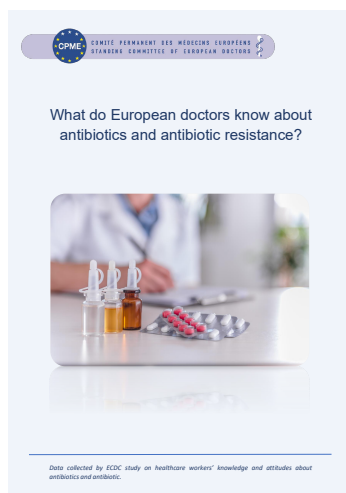
Рис. 5. Титульний лист опитувальника «Що європейські лікарі знають про антибіотики і антибіотикорезистентність?»