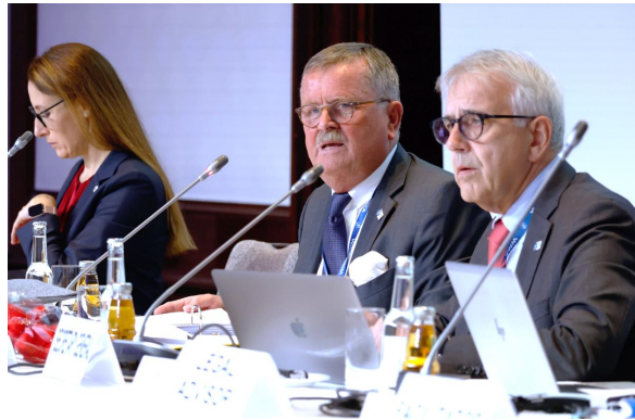
Рис. 7. Професор Д-р Франк Ульріх Монтгомері (у центрі)