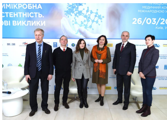
Рис. 6. Учасники експертного засідання щодо стану протимікробної резистентності в Україні, що відбулося в рамках І Національного медичного конгресу з міжнародною участю «Протимікробна резистентність. Світові виклики». м. Київ, 26 березня 2021 року

Постійний Комітет Лікарів Європи долучився до проведення науково-практичної конференції «Неінфекційні хвороби: національний план дій», який було проведено 5 листопада 2021 року в Києві за організації ВУЛТу і компанії «Моріон». У своєму листі Президент Постійного Комітету Лікарів Європи професор Д-р Франк Ульріх Монтгомері зазначив про важливість запровадження профілактичних заходів для попередження розвитку основних неінфекційних хвороб. Він зауважив про необхідність впливу на такі спільні чинники ризику розвитку неінфекційних хвороб, як нераціональна дієта, тютюнопаління, вживання алкоголю та малорухливий спосіб життя. Також наголосив про спільні заходи, що проводять європейські та українські лікарів щодо інформування про негативний вплив неінфекційних хвороб на тривалість життя людей.