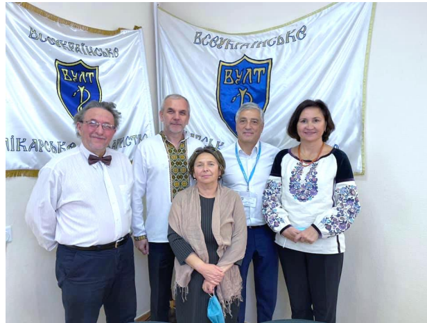
Рис. 11. Обговорення питань представництва української лікарської спільноти в UEMS у рамках XVIII з'їзду Всеукраїнського Лікарського Товариства, м. Київ, 6 листопада 2021 року