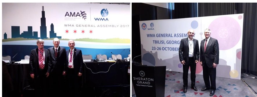
Рис. 1. Тісна співпраця українських лікарів зі світовою лікарською спільнотою. Делегати ВУЛТ на Генеральних Асамблеях Світового Лікарського Товариства у Чикаго 2017 рік і Тбілісі 2019 рік