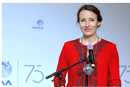
Рис. 3. Президент WMA Д-р Гейзі Стенсмирен

Пандемія COVID-19 не тільки не ослабила взаємодію із WMA, а навпаки, зробила стосунки української і світової лікарських спільнот більш тісними. Світове Лікарське Товариство активно долучалось до роботи науково-практичних заходів, що проводило Всеукраїнське Лікарське Товариство. Спільне бачення проблеми основних неінфекційних хвороб було задеклароване на науково-практичній конференції «Неінфекційні хвороби: національний план дій», що відбулась в Україні 5 листопада 2021 року. Президент Світового Лікарського Товариства Д-р Гейзі Стенсмирен у своєму відеозверненні до українських лікарів зазначила: «Неінфекційні захворювання є основними причинами погіршення стану здоров'я, передчасної смерті та суттєво зменшують тривалість життя людей як у світі, так і в Україні. Неінфекційні захворювання призводять до значних соціальних та економічних витрат, у тому числі значних витрат на медичну допомогу».